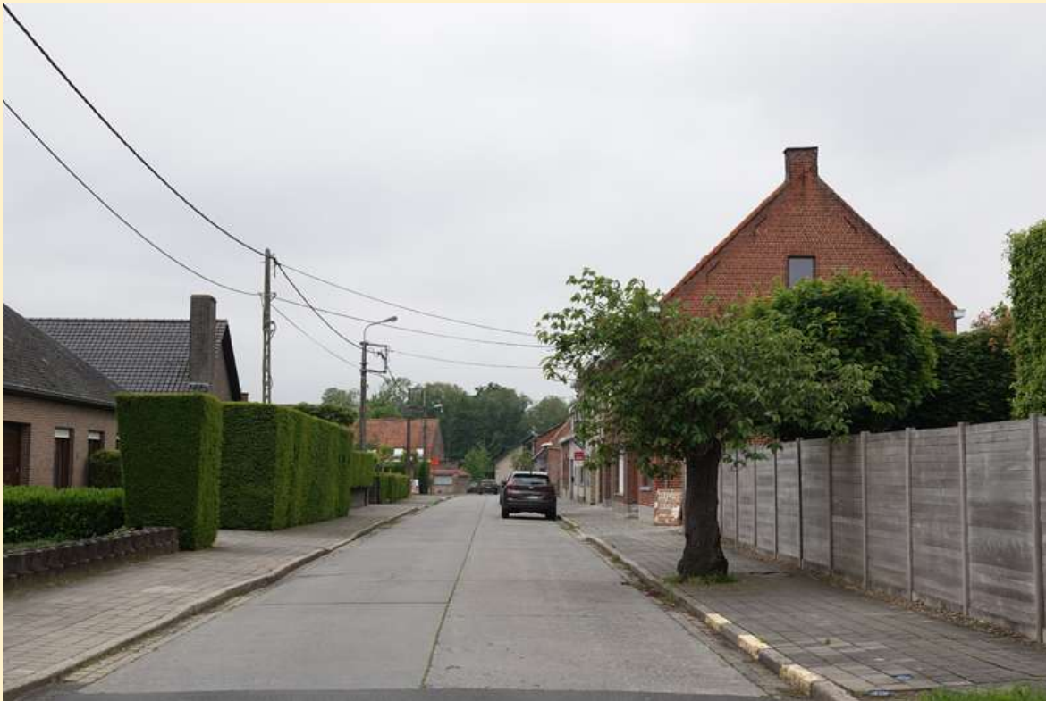
Kaart Steenmolenlaan Informatie Molenecho's – Bergmolen – Stenen Molen

De molen is gebouwd ~1720-1826 en gedynamiteerd op 1 november 1914. Hij staat al aangeduide op de Ferrariskaart (1777). Op de Vandermaelenkaart (1846-54) staat nog een 2 de molen iets noordelijker aan de Kloosterstraat.