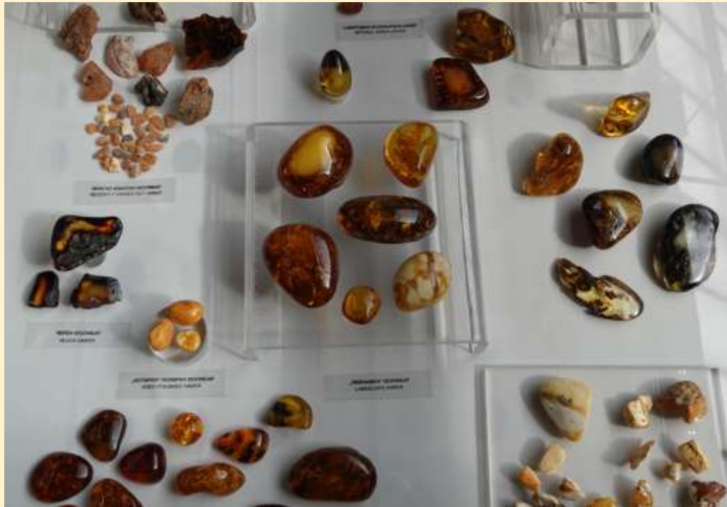
Amber, verz. Earth and Man Museum, Sofia, Bulgarije

Amber is fossiel boomhars. Het is organisch materiaal en geen mineraal. Het wordt in juwelen gebruikt.