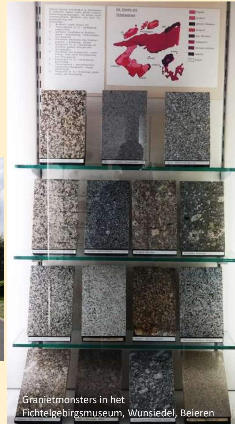
Granietmonsters in het Fichtelgebirgsmuseum, Wunsiedel, Beieren

Kaart Granietstraat Gesteente graniet Informatie