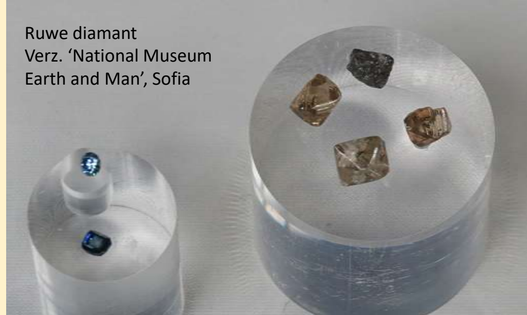
Ruwe diamant Verz. 'National Museum Earth and Man', Sofia

Kaart Diamantstraat Mineraal diamant Informatie West-Vlaamse Bedrijven : De Diamantnijverheid te Diksmuide