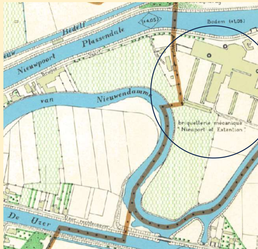
Topgrafische Kaart Openbare Werken en Wederopbouw 1950-1970

De 6 oude kleiputten Viconia zijn sinds 1981 een 40 ha groot natuurreservaat van het Agentschap voor Natuur en Bos .