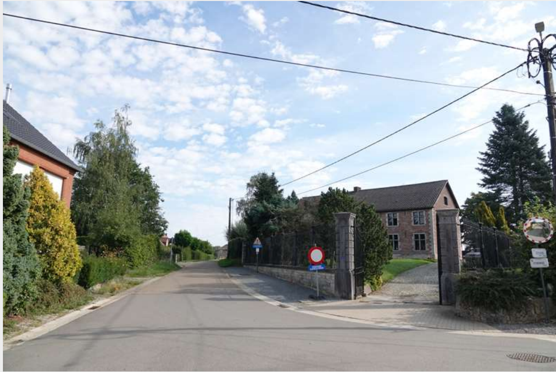
Kaart Stenenhuisstraat Informatie