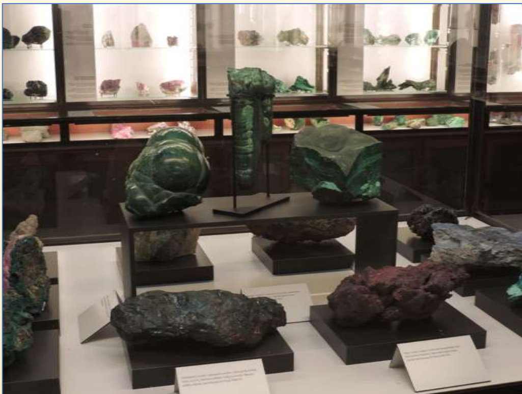
Malachiet , Katanga, collectie AfricaMuseum

In Tervuren bevindt zich het AfricaMuseum met een grote collectie mineralen, fossielen en gesteenten uit Centraal-Afrika.