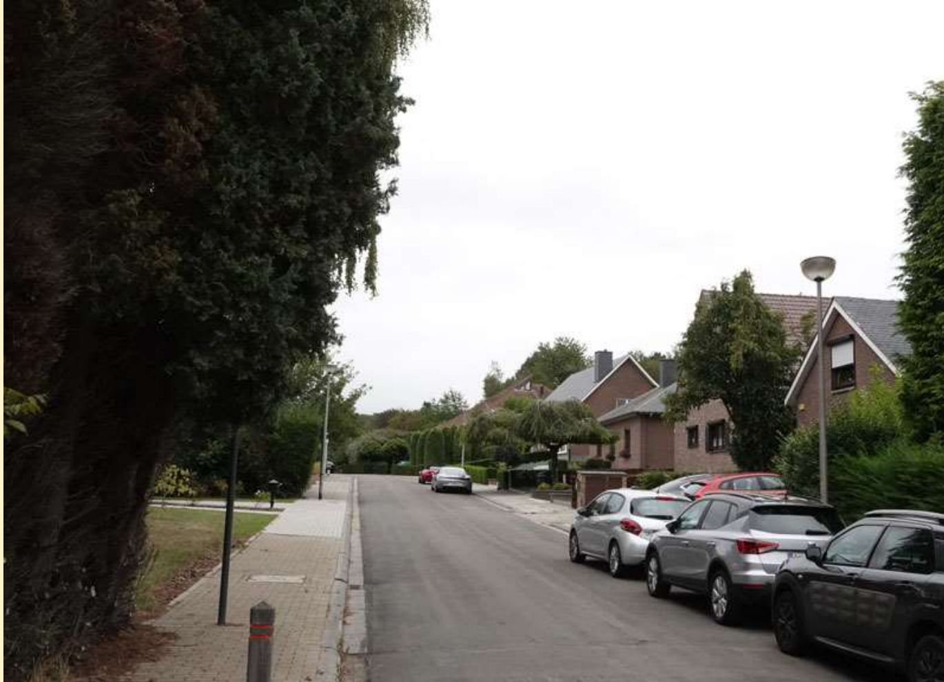
Kaart Steenbakkerijlaan Informatie