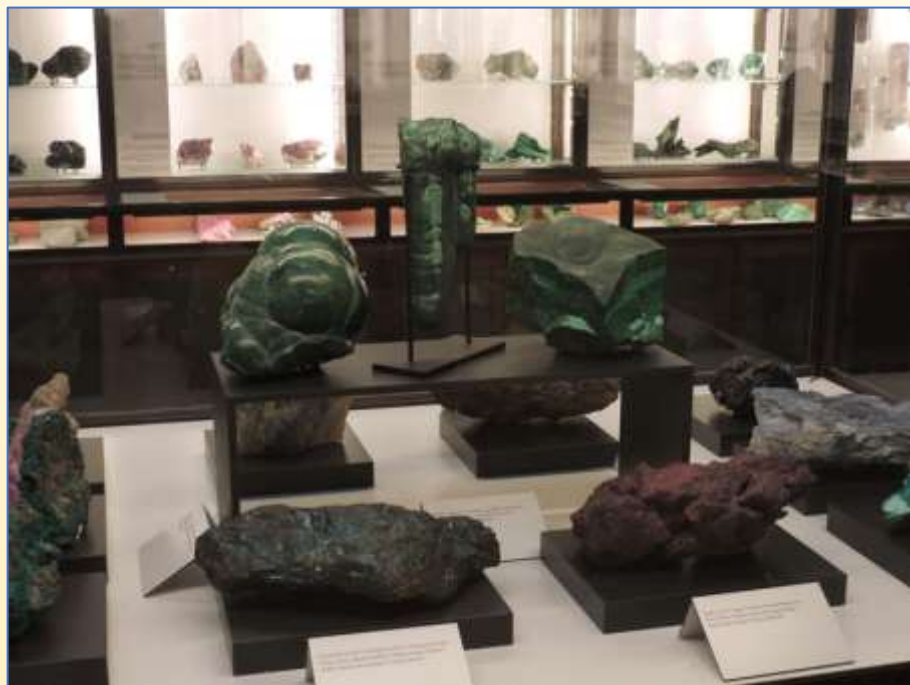
Malachiet , Katanga, collectie AfricaMuseum

In Tervuren bevindt zich het AfricaMuseum met een grote collectie mineralen, fossielen en gesteenten uit Centraal-Afrika.