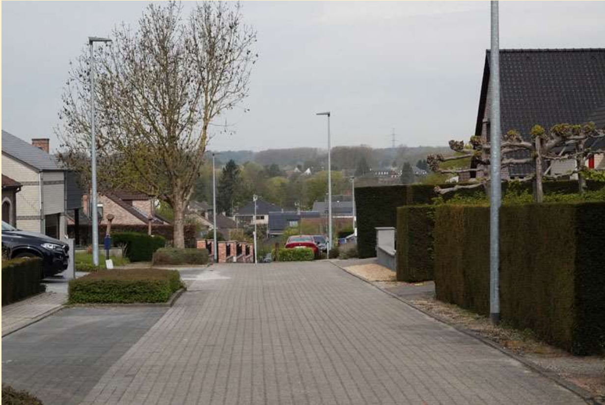
Kaart Kareeloven Informatie

Tot in de jaren '50 was er een steenbakkerij op de hoek van de Galgstraat en de Edouard Rooselaersstraat, iets zuidelijker van de straat 'Kareeloven'. In een kareeloven werden vierkante gebakken stenen.