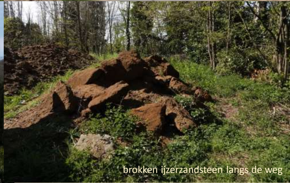
brokken ijzerzandsteen langs de weg