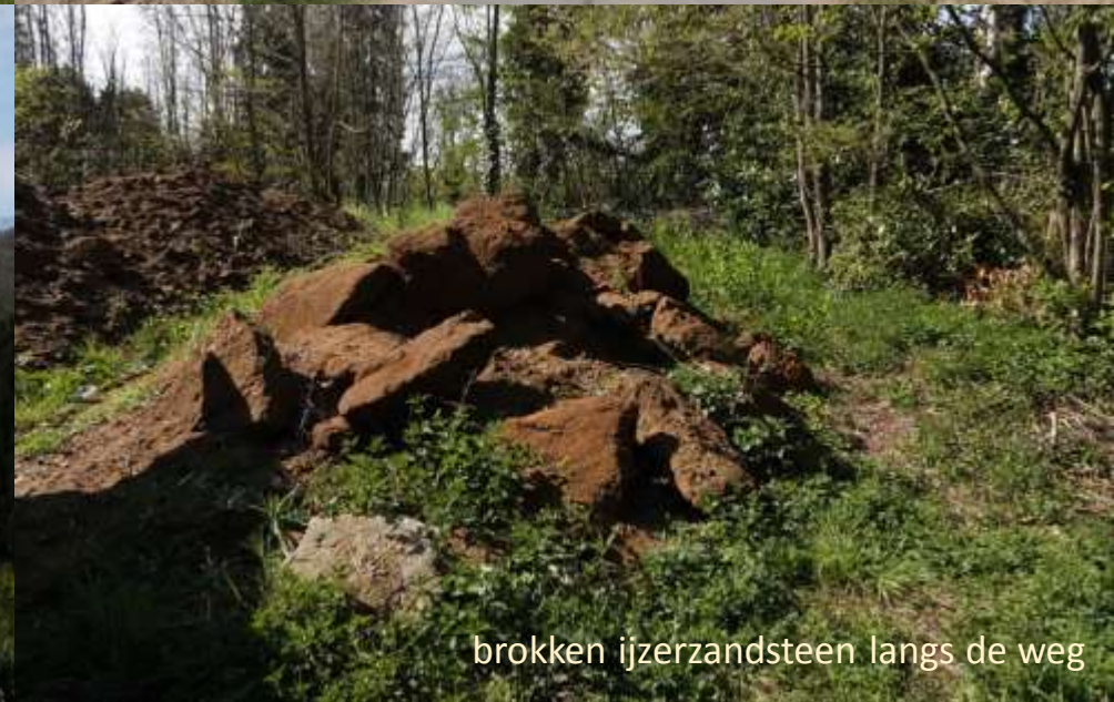
brokken ijzerzandsteen langs de weg