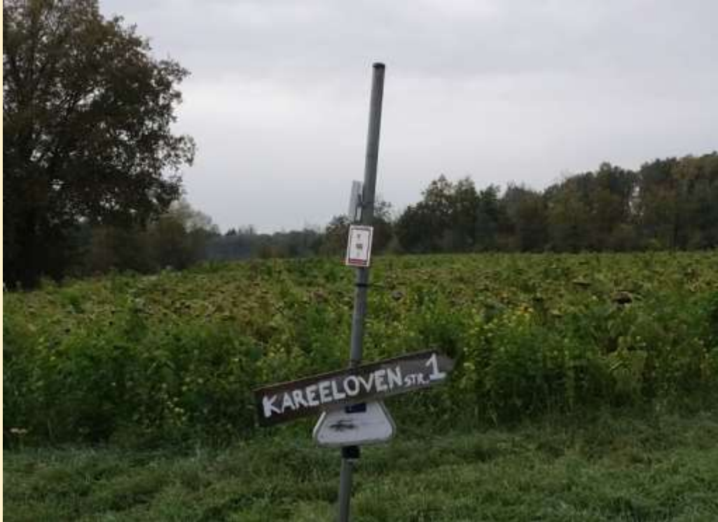
Kaart Kareelovenstraat Informatie