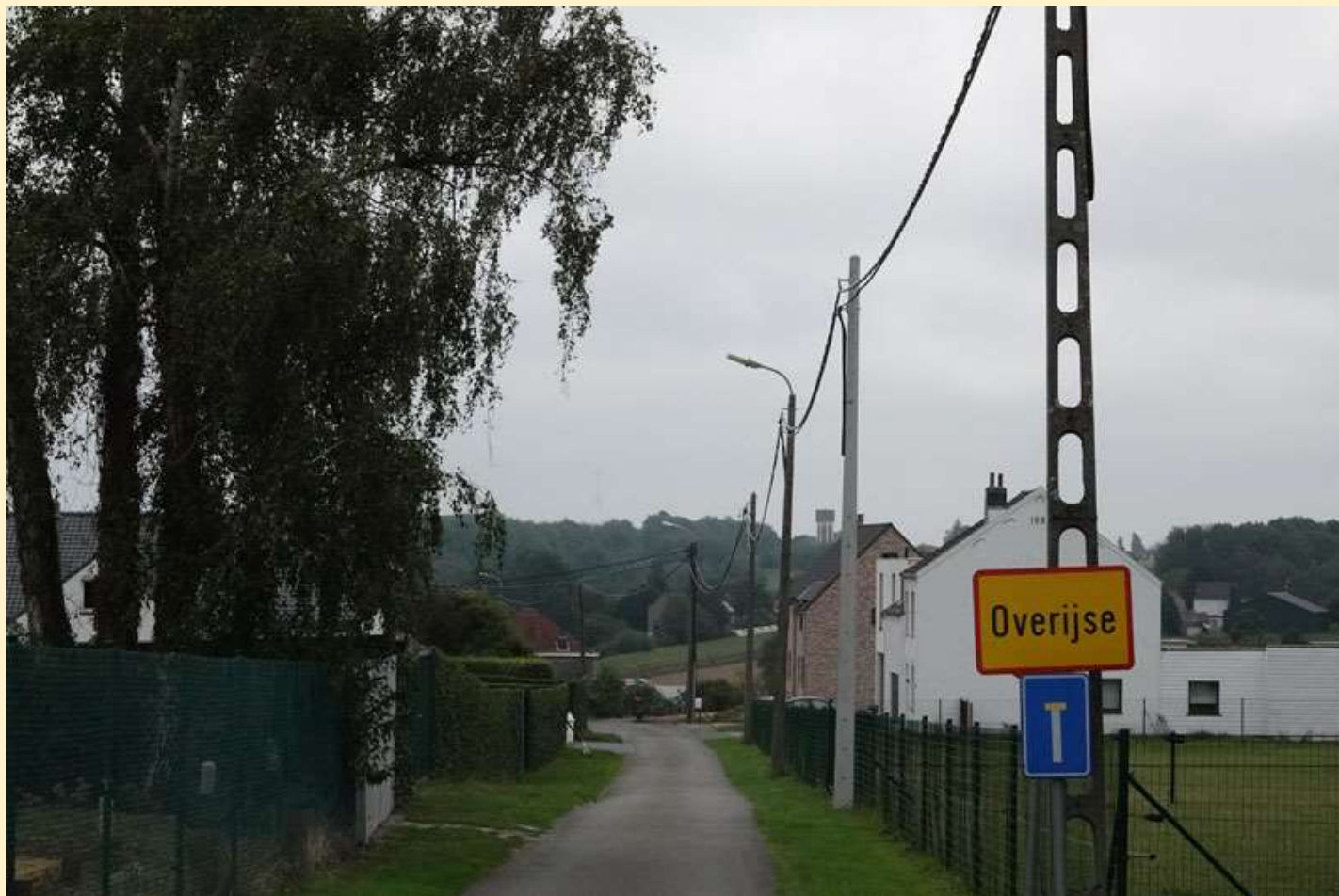
Kaart Steenbakkersweg Informatie