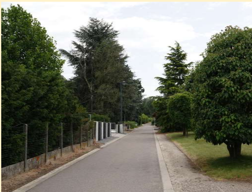
Kaart Zandbergstraat Informatie