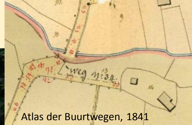
Atlas der Buurtwegen, 1841