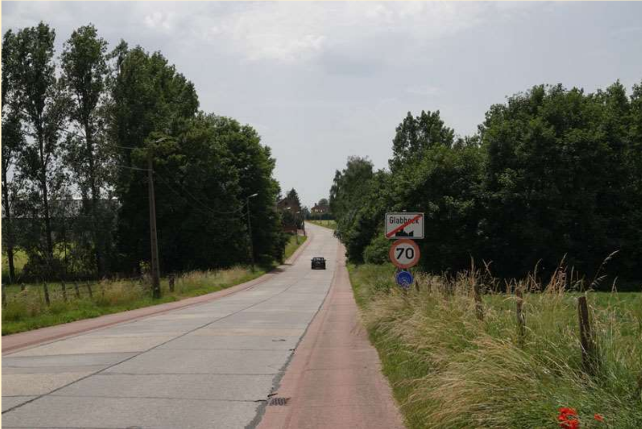
Kaart Steenbergestraat Informatie

De Steenbergestraat loopt door tot in de deelgemeente Attenrode. De benaming komt al voor op de Villaretkaart (1745-48) als 'Stienbergh'.