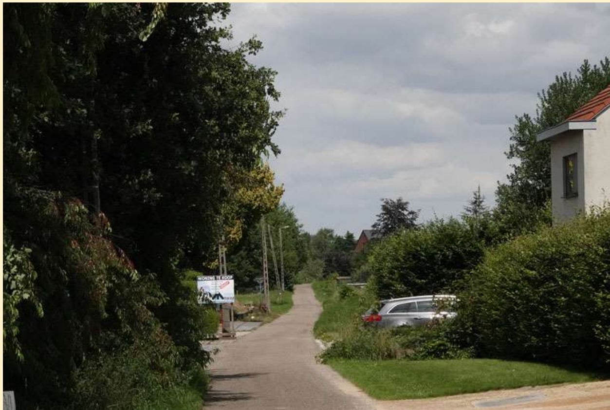
Gips , Betekom, ~5cm breedte