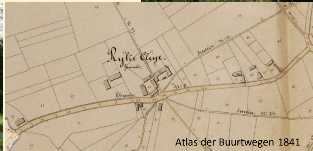
Atlas der Buurtwegen 1841