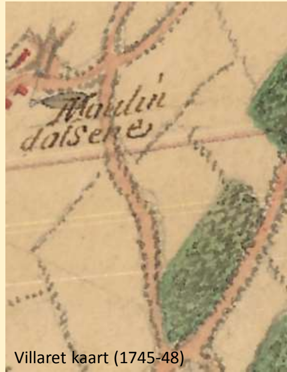
Villaret kaart (1745-48)

Buiten de Stenemolenstraat is er ook een Molenstraat.