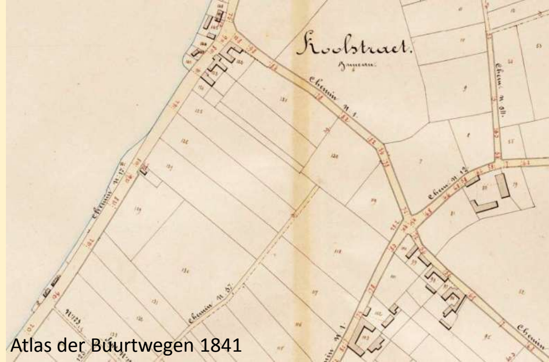
Atlas der Buurtwegen 1841

De naam 'Koolstraat' staat al op de kaart Atlas der Buurtwegen 1841 en de straat zelf is al aangegeven op de Ferrariskaart (1771). Of de straatnaam verband houdt met houtskoolwinning op deze plaats is onzeker. In het Berlarese dialect klinkt de naam Koolstraat als 'Kulstroat' – niet als houtkool.