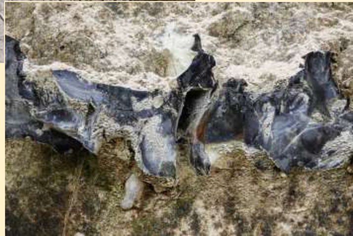
Silex-lagen in de ENCI-steengroeve Sint-Pietersberg, Maastricht

Kaart Silex Gesteente flint Informatie Vuursteen - wikipedia