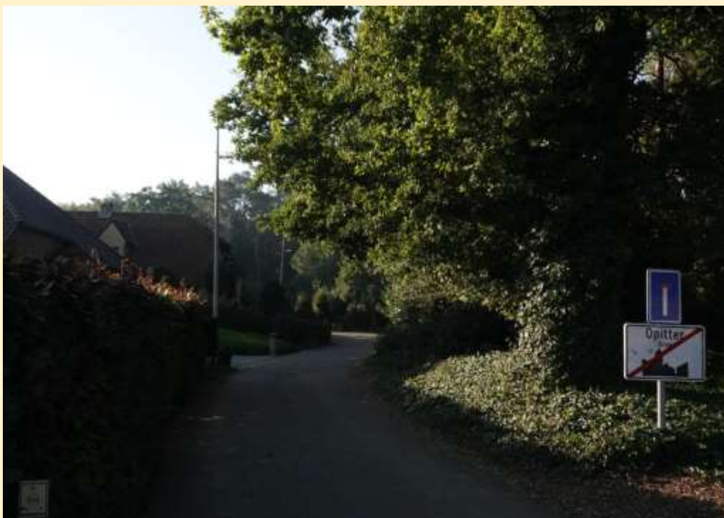
Kaart Zandbergstraat Informatie