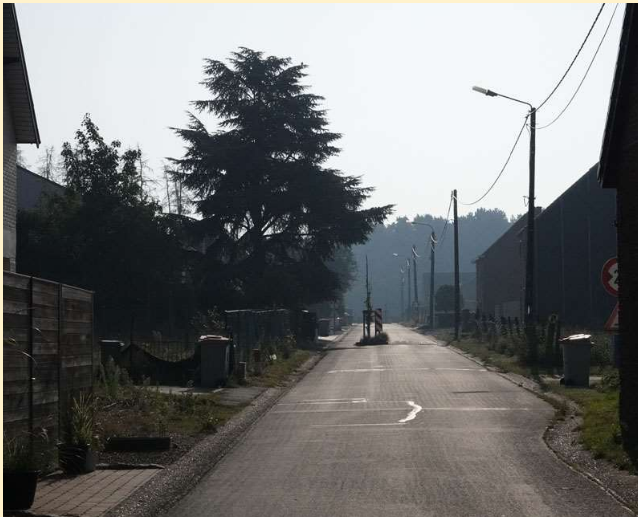
Kaart Zavelstraat Informatie