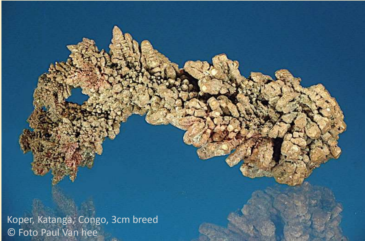
Koper, Katanga, Congo, 3cm breed

Gedegen koper komt in de natuur als mineraal voor.