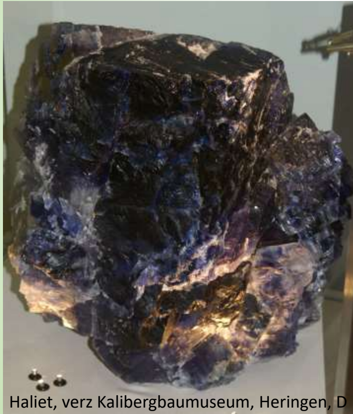
Haliet, verz Kalibergbaumuseum, Heringen, D

De stad en provincie Salzburg danken hun naam aan de zoutmijnen in de buurt van de stad. Natuurlijk 'zout' is het mineraal haliet .